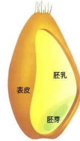
図 1. 小麦粒の構成 (1)

小麦粒は、大まかに外皮(表皮)、胚乳、胚芽で構成されています。その割合は、外皮が 13～17%、胚乳が 81～85%、胚芽が 2%。成分組成は品種や栽培条件による差が大きく、デンプンを中心とした糖質がおよそ 70%、粗たんぱく質 10～13%、食物繊維 2～5%、脂質 1.5～2.5%、灰分 1.2～2.5%であり、各種ビタミン、ミネラル、酵素も含まれます (2) 。